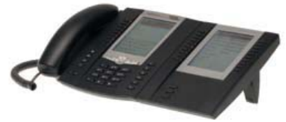
OpenPhone 75/75IP 75D billentyűzet bővítővel

Az Upn és az IP mellékoldali portokon az Aastra új rendszertelefonjait használhatja: az OpenPhone 71, OpenPhone 73/73IP valamint az OpenPhone 75/75IP készülékeket, továbbá az OpenPhone IPC SoftPhone alkalmazást, amely notebookon vagy asztali számítógépen a rendszertelefonok komfortját nyújtja. A 73P és 75D billentyűzetbővítők teszik teljessé a kényelmes használatot.